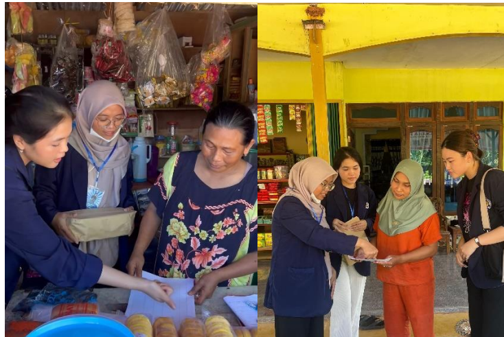
Gambar 2. Penyampaian Contoh Bentuk Laporan Keuangan

Metode sosialisasi secara langsung ini tidak hanya memudahkan peserta dalam menerima materi, tetapi juga memberikan peluang bagi tim untuk menjalin komunikasi yang lebih intens dan personal dengan masing-masing peserta. Pendekatan ini dinilai lebih efektif karena memungkinkan terjadinya diskusi mendalam dan interaktif, di mana peserta dapat bertanya langsung tentang permasalahan yang mereka hadapi dalam mengelola keuangan usaha mereka. Selain itu, suasana yang lebih santai dan akrab membantu peserta untuk lebih nyaman dalam menerima materi.