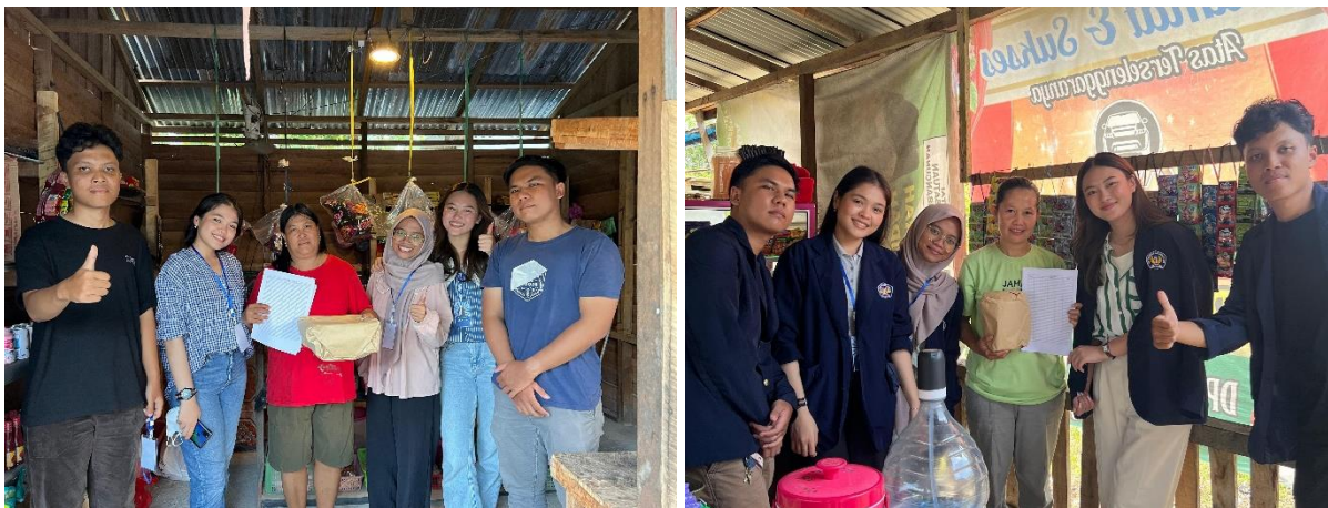
Gambar 3. Foto Bersama dengan Pemilik Usaha

Pencatatan beberapa transaksi pertama masih didampingi tim PKM untuk meminimalisir kesalahan peserta yang mungkin belum memahami materi sepenuhnya. Kesalahan tersebut atau human error dapat berujung pada misinformasi dari laporan mengakibatkan pengambilan keputusan yang tidak tepat di masa mendatang jika menggunakan dasar laporan keuangan yang tidak tepat. Sebelum menyelesaikan kegiatan ini pada satu lokasi, tim akan meminta umpan balik dari peserta terhadap materi yang telah disampaikan. Umpan balik ini sangat penting bagi tim PKM, karena dapat digunakan sebagai bahan evaluasi untuk meningkatkan kualitas dan efektivitas kegiatan sosialisasi selanjutnya. Dalam sesi ini, peserta juga mengungkapkan berbagai kendala yang mereka hadapi dalam membuat laporan keuangan, baik dari segi teknis maupun non-teknis, seperti kurangnya waktu luang untuk mencatat transaksi setiap hari. Tim PKM memberikan solusi praktis bagi setiap masalah yang dihadapi peserta, misalnya dengan memberikan alternatif pencatatan yang lebih sederhana atau penggunaan aplikasi keuangan yang mudah dioperasikan. Dengan adanya sesi umpan balik ini, diharapkan peserta dapat lebih percaya diri dalam menerapkan ilmu yang telah mereka peroleh, sekaligus memberikan masukan yang konstruktif bagi tim PKM untuk memperbaiki program ini di masa depan.