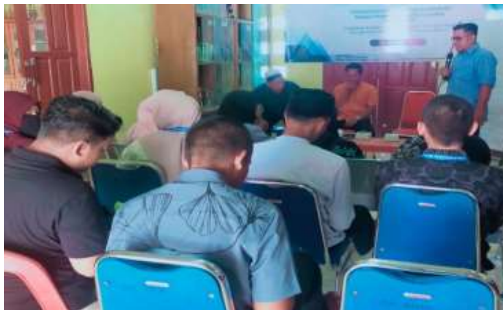
Gambar 2. Pemaparan Materi Konten Digital edukasi Kreatif

Berdasarkan Data diatas menunjukkan bahwa minat remaja masjid dalam mengikuti kegiatan pelatihan tersebut sangat besar. Dari persentase ini menunjukkan peserta pelatihan sadar bahwa pengetahuan terhadap literasi konten digital yang dilakukan selama ini masih jauh dari kata maksimal. Dalam pelatihan ini, diperkenalkan tentang pembuatan konten digital, pemanfaatan media digital dan juga media saluran distribusi konten. Hal ini sangat penting diperkenalkan dalam pelatihan ini dalam upaya mewujudkan keberhasilan usaha yang dijalankan oleh para remaja masjid dan pemuda di Gampong Meunasah Masjid. Proses ini terus berlanjut dalam bentuk pelatihan untuk membentuk ketrampilan pembuatan konten edukasi digital yang dinamis dan maksimal. Proses pelaksanaan pelatihan ini merupakan wujud nyata dalam memberikan sumbangan pemikiran secara akademis terkait dengan kemampuan pembuatan konten dan pemanfaatan media digital sebagai saran edukasi.