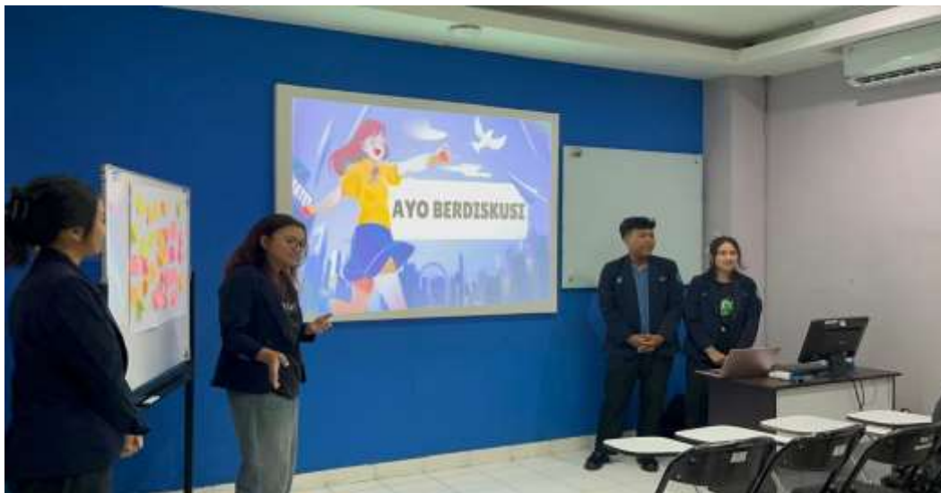
Gambar 2. Sesi Berbagi ( Shering Seasion )

Pelaksanaan kegiatan dilakukan melalui penyampaian materi, diskusi interaktif, serta sesi berbagi pengalaman antar peserta. Mahasiswa diberikan pemahaman mengenai pentingnya manajemen waktu ( time-management ), penentuan skala prioritas, serta strategi dalam mengelola aktivitas sehari-hari. Selain itu, peserta juga diberikan kesempatan untuk menyampaikan kendala yang dihadapi serta solusi yang dapat diterapkan sesuai dengan kondisi masing-masing.