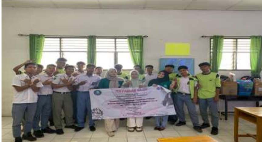
Gambar 3. Foto Bersama Dengan Siswa