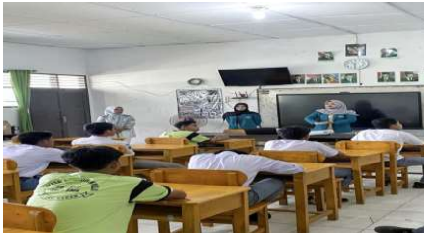
Gambar 2. Pada Saat Sesi Diskusi

keterampilan sosial dalam penyelesaian konflik, serta penguatan budaya sekolah yang anti-kekerasan. Hasil dan pembahasan dalam bagian ini disajikan secara komprehensif mencakup aspek kognitif, afektif, sosial, serta analisis keberhasilan program berdasarkan indikator yang telah ditetapkan.