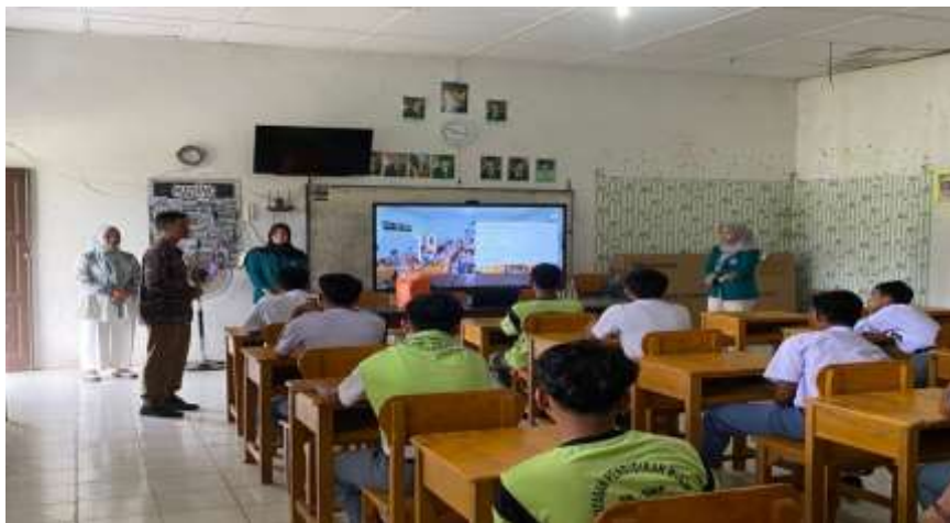
Gambar 1. Pada Saat Penyampaian Materi

Kegiatan dinilai berhasil apabila sebagian besar indikator dalam tabel menunjukkan perubahan positif berdasarkan hasil evaluasi kuantitatif dan analisis kualitatif.